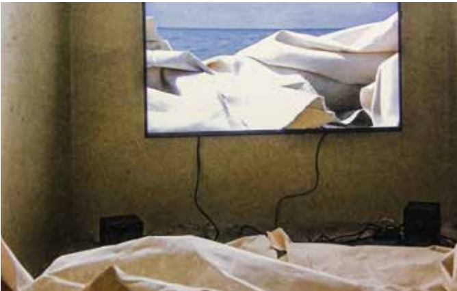
Günther Uecker: Tücher (2017)

Sonntag, 4., 11. und 18. März, 10 Uhr Passion – Ein Gedicht, ein Lied, ein Bild