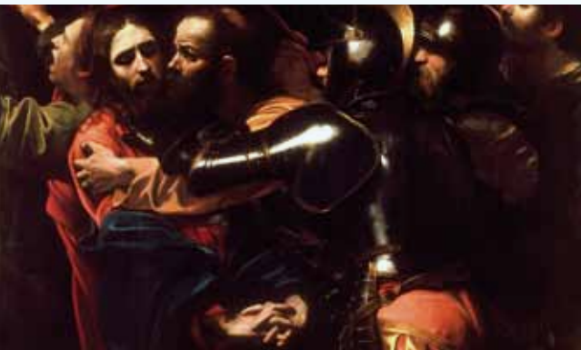
The Taking of Christ - Caravaggio

Eintritt: 6-32 €; VVK: Konzertkasse Gerdes (040/453326), www.eventim.de und AK